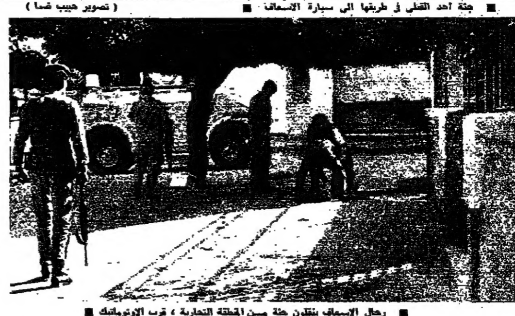
رجال الاسفد ينظرون جثة من المنطقة التجارية، قرب الاوتوماتيك

ويعد ذلك استمعي الرئيس الاسبق الصالحين وادلى لهم بالتصريح التالي: لقد رفعت القضية اليسوم (اسي) للاسباب الانية التي تعرفونها اضافة الى الاسباب الاخرى المحروقة والتي تجعل النواب يفتشون الى لجسي وعلى كل حال فان القنصه الرافضة جعلتنا نرفع القضية، ونحن بانتظار بطلور الامور لتعين موعد جلسة جديدة.